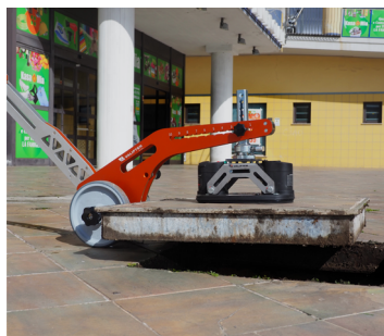
Para tapas rellenas