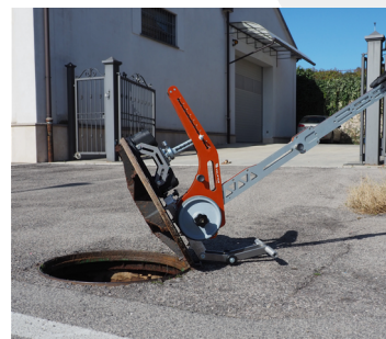
Para tapas abatibles