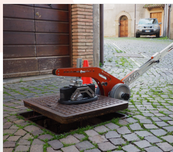
Para tapas ferromagnéticas